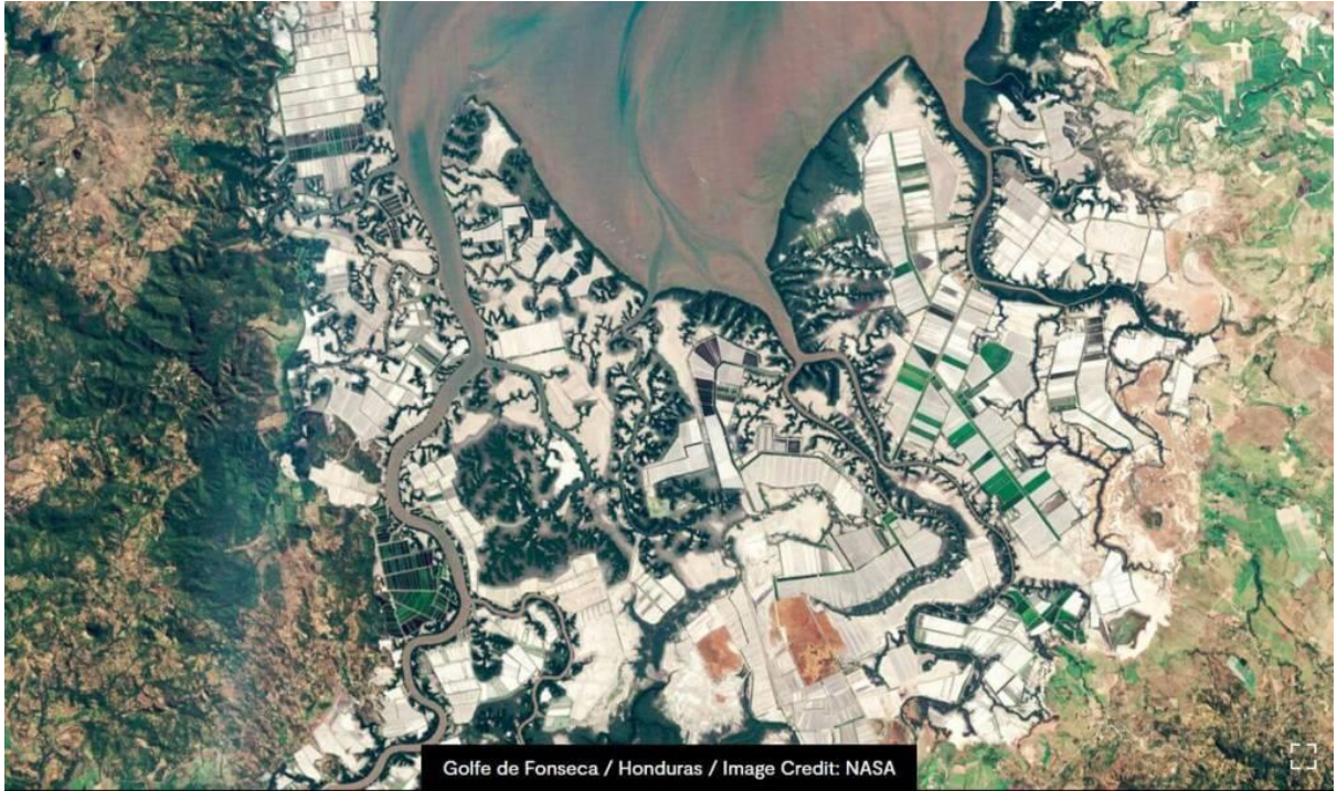
Golfe de Fonseca / Honduras