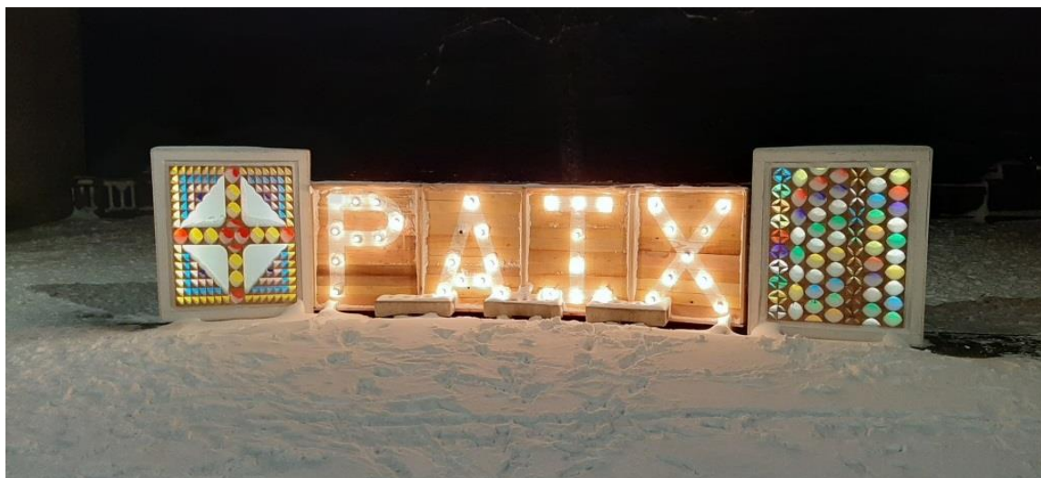
Place Marel – Noël 2020

Toute l'équipe municipale vous souhaite une bonne et heureuse année 2021 !