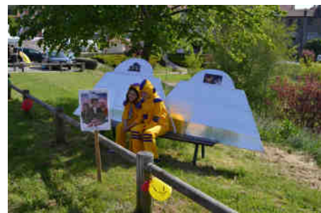
La sou (cou) pe aux choux