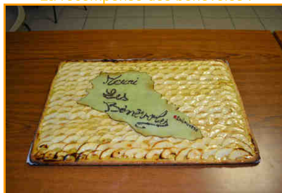
made in Costagliola