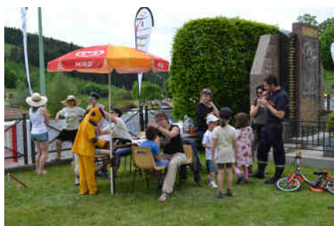
Atelier maquillage pour les enfants