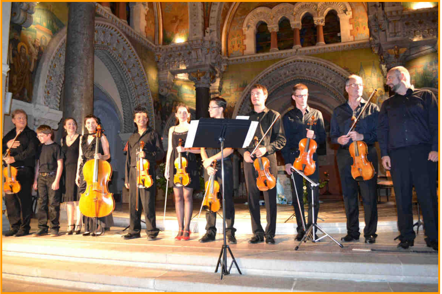
Les musiciens (presque au complet)