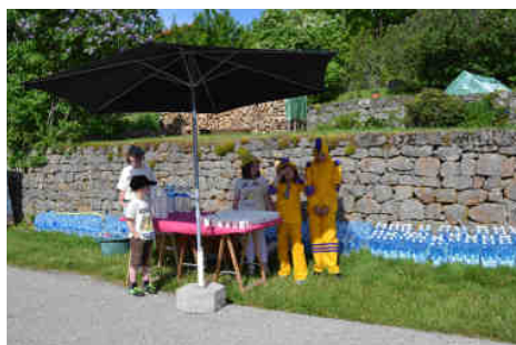
Le ravitaillement en eau