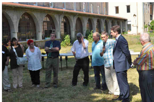
Les discours des officiels